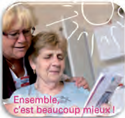
Ensemble, c'est beaucoup mieux !

En Belgique, 1 sénior sur 10 n'a plus aucun contact social (famille, amis,...) et 1 personne sur 7 vit seule. Pour ces personnes, le quotidien est parfois triste et compliqué. C'est pourquoi la Croix-Rouge propose un service gratuit pour les soutenir. Il permet à celles et ceux qui souffrent de la solitude de rencontrer nos volontaires, ponctuellement ou régulièrement, pour partager un moment à deux : bavarder autour d'une tasse de café, faire une promenade, organiser une activité en groupe ou un déplacement.