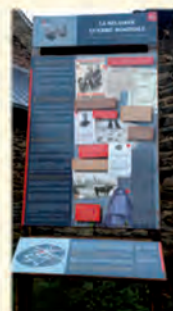
Exemple de panneau d'interprétation historique (Porcheresse)

Le projet veut rendre tangible le passé , amener les enfants à réfléchir sur ces événements mais également à la vie actuelle, la liberté et la paix dont nous jouissons. Les panneaux mettront en lien le passé avec les événements actuels du monde. Ils parleront aussi de sujets sociétaux tels que l'importance de la solidarité entre individus et le respect d'autrui, fondements de la liberté et des sociétés démocratiques . Ils permettront d'aborder l'histoire d'une manière différente et concrète, en allant sur le terrain. De plus, ils seront agrémentés de photographies d'époques, cartes, témoignages, objets photographiés, etc. et seront placés à des endroits phares. »