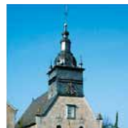
Haut de Tellin