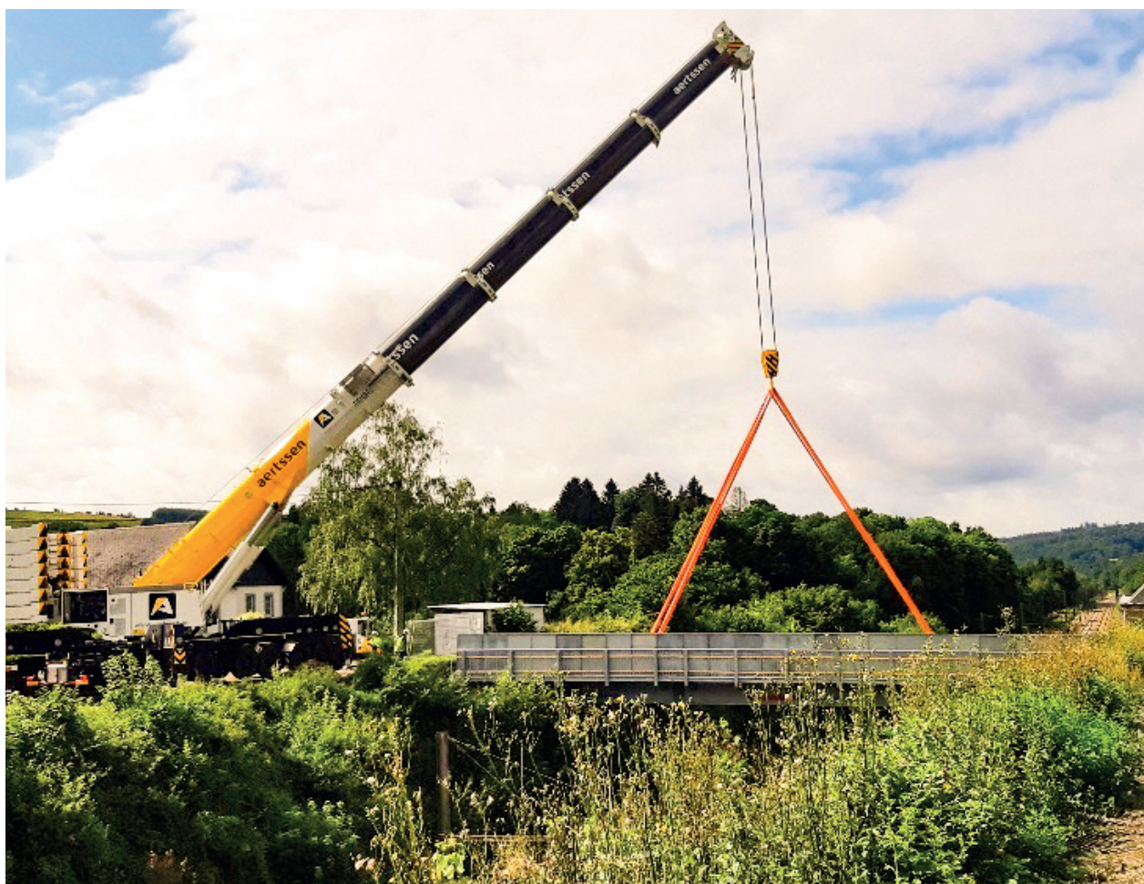
Pose du Pont provisoire à Grupont.