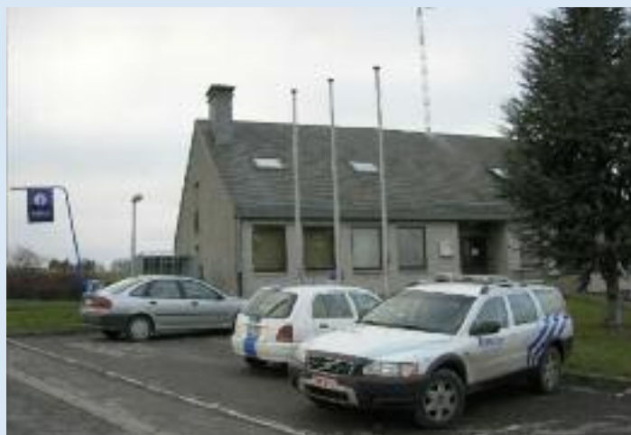
Rue Saint-Roch 154 à 6927 Tellin