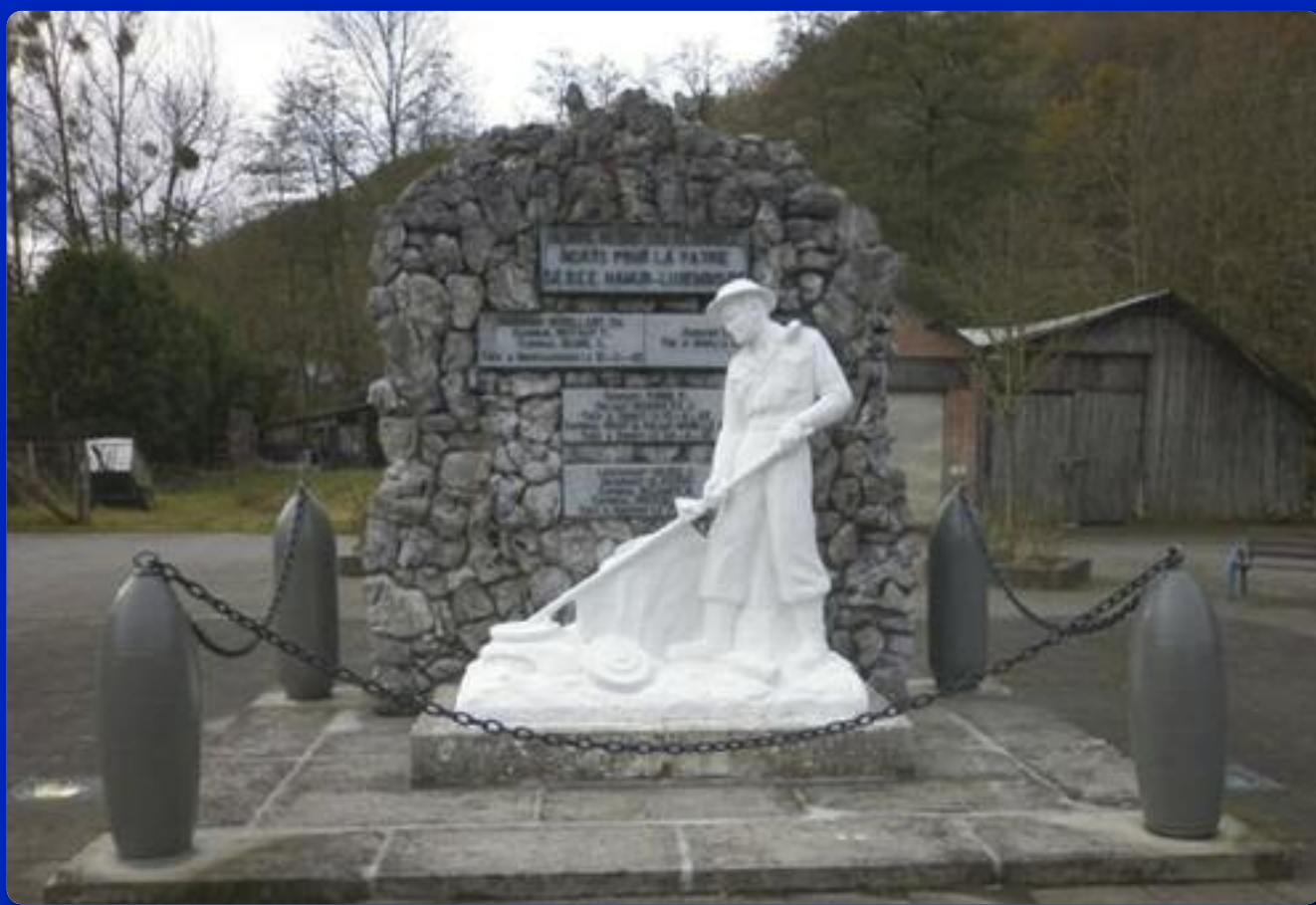
Monument des Démineurs à Grupont

Bulletin Communal - bimestriel mars 2013 - n° 143