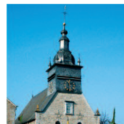
Église de Grupont