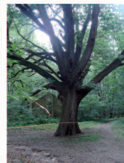
1) Plan de BURES. 2) Vue d'un quartier de Bures 3) Château de Bures). 4) Trail du Vieux Lavoir 2010 au premier plan veste noire David DOUILLET député des Yvelines à l'époque présent pour remettre les trophées aux athlètes de cette course. 6) Arbre remarquable

*Nombre de participations a EUROPA BURES