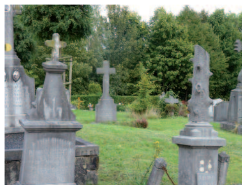
Cimetière engazonné à Lasne (Pôle GD)

wallonnes, dont Tellin. Ce mois-ci, une enquêtrice a passé 3 jours dans la commune et a posé une dizaine de questions aux passants pour mieux comprendre comment ils perçoivent et acceptent la végétation spontanée. Les résultats, qui seront communiqués en septembre, donneront des informations utiles aux services communaux.