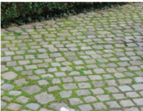
Pavés sans herbicide chimique (Pôle GD)

Une grande partie de l'entretien des espaces publics consiste à limiter ou éradiquer la végétation spontanée, souvent appelée à tort « les mauvaises herbes », qui pousse sur les trottoirs, dans les massifs floraux, dans les cimetières etc. Cette gestion se fait souvent à grand renfort de produits chimiques, qui sont plus dangereux que les plantes qu'ils tuent ! Or, dans une démarche de gestion différenciée, on s'attache à réduire, voire supprimer, l'utilisation de ces produits qui ne sont pas seulement toxiques pour les plantes, mais aussi pour les animaux et pour l'Homme. Il existe différentes méthodes de désherbage moins dangereuses (machines thermiques ou mécaniques), mais elles sont encore imparfaites. Une solution qui se présente alors est d'accepter un peu d'herbe spontanée à certains endroits, ou pourquoi carrément pas de semer du gazon ! Ainsi, on pourrait voir de l'herbe entre les pavés ou sur