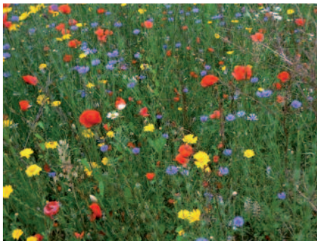
Pré fleuri à Tellin (C. Bassiaux)

Une grande partie de l'entretien des espaces publics consiste à limiter ou éradiquer la végétation spontanée, souvent appelée à tort « les mauvaises herbes », qui pousse sur les trottoirs, dans les massifs floraux, dans les cimetières etc. Cette gestion se fait souvent à grand renfort de produits chimiques, qui sont plus dangereux que les plantes qu'ils tuent ! Or, dans une démarche de gestion différenciée, on s'attache à réduire, voire supprimer, l'utilisation de ces produits qui ne sont pas seulement toxiques pour les plantes, mais aussi pour les animaux et pour l'Homme. Il existe différentes méthodes de désherbage moins dangereuses (machines thermiques ou mécaniques), mais elles sont encore imparfaites. Une solution qui se présente alors est d'accepter un peu d'herbe spontanée à certains endroits, ou pourquoi carrément pas de semer du gazon ! Ainsi, on pourrait voir de l'herbe entre les pavés ou sur