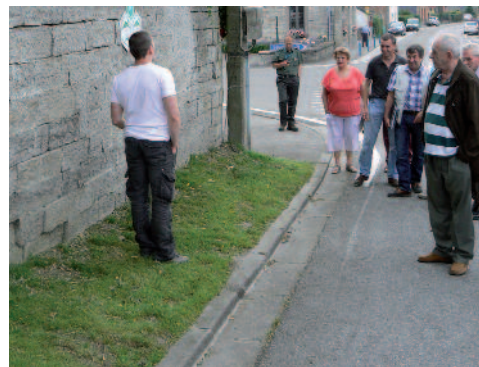
Trottoir enherbé à Tellin

un trottoir enherbé à Tellin ou du gazon dans les cimetières. Mais les citoyens wallons sont-ils prêts à accepter cela ? C'est ce que le Pôle wallon de gestion différenciée* est en train d'évaluer grâce à une enquête publique réalisée dans 11 communes