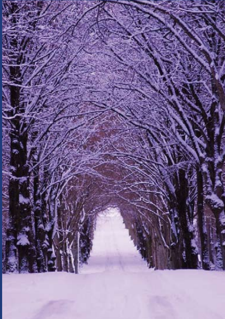
Dimanche 31 janvier 2010.

Bulletin Communal - bimestriel mars 2010 - n° 125