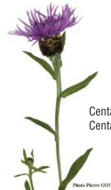
Centaurée jachée – Centaurea jacea