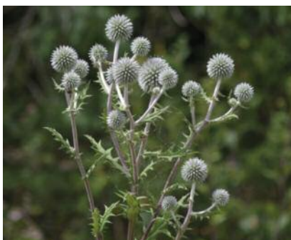
Echinops à tête ronde – Echinops sphaerocephalus