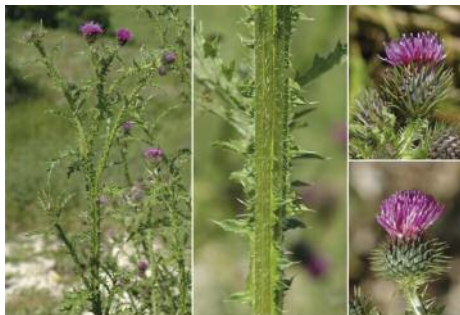
Carduus crispus ou chardon crépeux