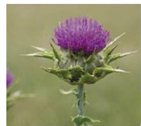
Chardon Marie – Silybum marianum

Si malgré tout, ces plantes ne sont pas les bienvenues dans votre jardin, sachez qu'il existe des techniques de lutte préventive ou curative que vous pouvez mettre en place :