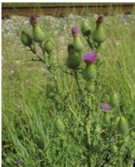
Cirsium lanceolatum / vulgare ou cirse lancéolé/commun

Il peut être confondu, entre autre, avec :