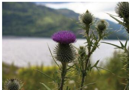
Onopordum faux-achanthe – Onopordum acanthium